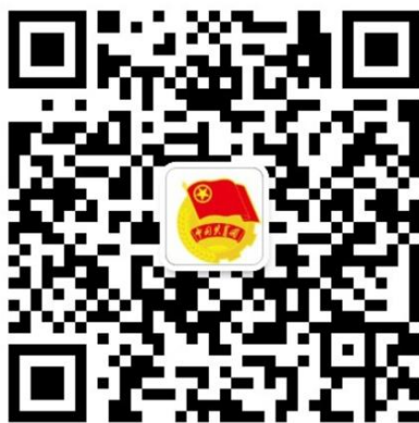
（“团中央权益部”微信公众号二维码）

(6) 本次活动采取网络报名方式，动员青少年于10月16日前关注“团中央权益部”微信公众号，进入“模拟政协”专栏进行报名，后续将开通作品提交、展示交流等功能。活动期间，还将开展青少年模拟政协提案征集活动标识设计评选，最终确定1个能够准确传递立意、艺术效果好的设计作品作为活动统一标识。同时，面向青少年征集参与活动的小故事，分享他们的经历、感悟与收获。请持续关注“团中央权益部”微信公众号动态。